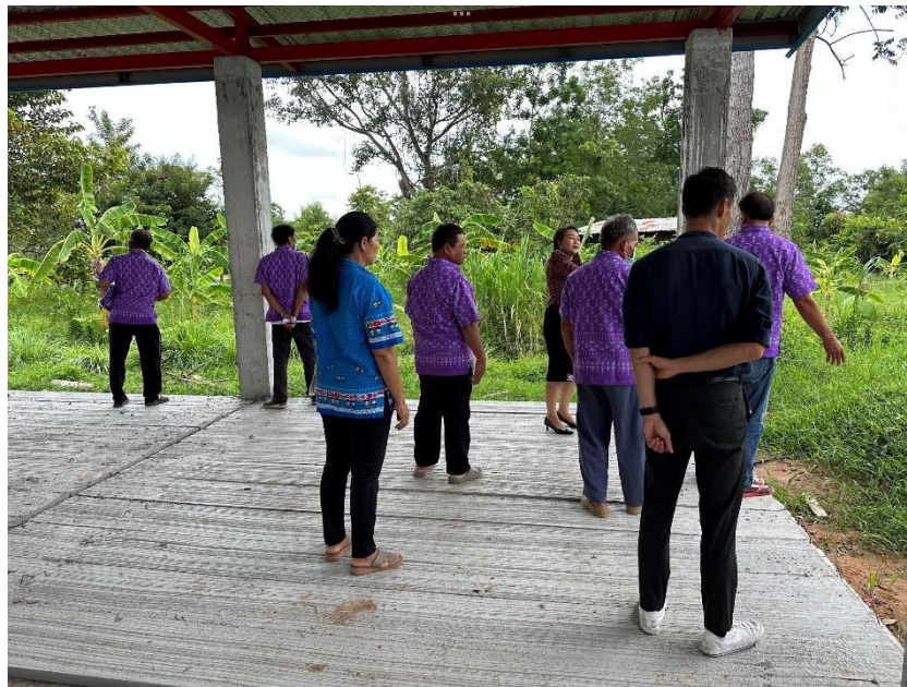
คณะกรรมการสถานศึกษา ผู้ใหญ่บ้าน ผู้บริหาร คณะครูโรงเรียนบ้านโคกแปะ ร่วมประชุมวางแผน แลกเปลี่ยน ให้ข้อเสนอแนะการดำเนินงานและกิจกรรมของโรงเรียน