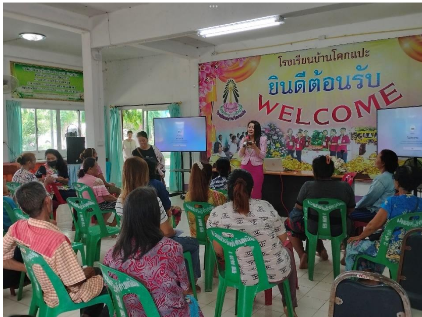
คณะกรรมการสถานศึกษา ผู้บริหาร คณะครู ผู้ปกครอง และนักเรียนโรงเรียนบ้านโคกแปะ ร่วมกิจกรรมประชุมผู้ปกครองประจำปีการศึกษา