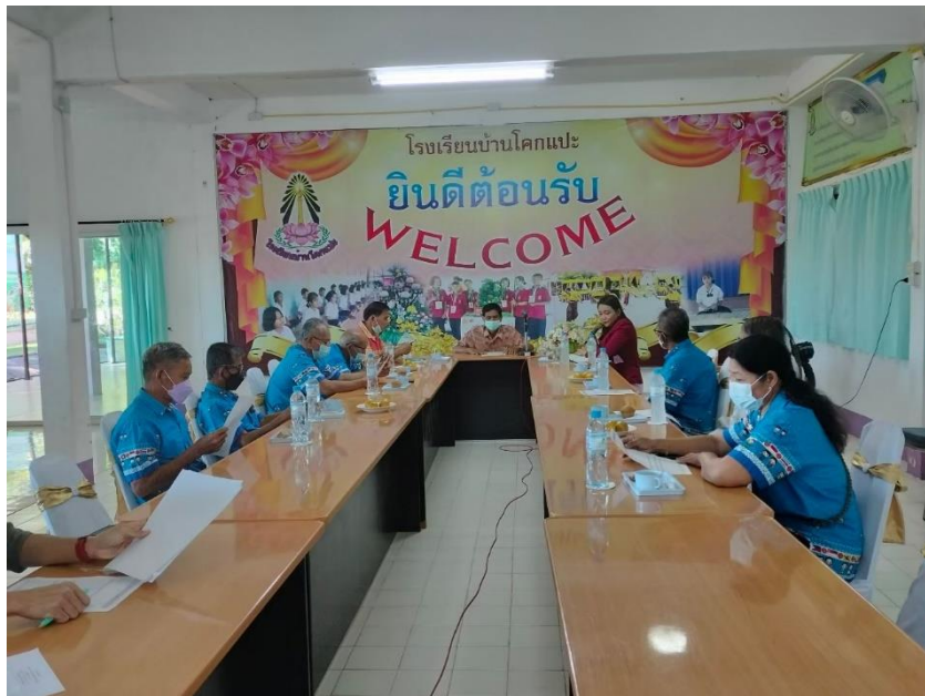
ประธานคณะกรรมการสถานศึกษา คณะกรรมการสถานศึกษา ร่วมประชุมกับโรงเรียนบ้านโคกแปะ การดำเนินงานของโรงเรียน ประเมินคุณธรรมและความโปร่งใสของสถานศึกษา