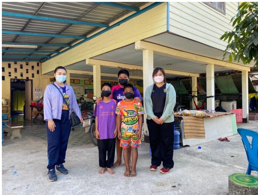
ผู้ปกครองนักเรียน คณะครู และนักเรียน โรงเรียนบ้านโคกแปะ ให้ความร่วมมือในการติดตามการเยี่ยมบ้านนักเรียน ติดตามความเป็นอยู่ของนักเรียน