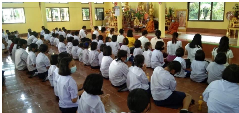
วัด ผู้บริหาร คณะครู โรงเรียนบ้านโคกแปะ ร่วมกิจกรรมทำบุญในวันสำคัญทางพระพุทธศาสนา