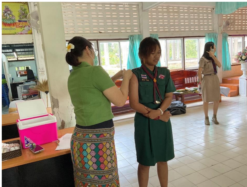
โรงพยาบาลส่งเสริมสุขภาพตำบลโคกสี คณะครู นักเรียน โรงเรียนบ้านโคกแปะ ให้ความร่วมมือให้นักเรียนได้รับวัคซีนป้องกันมะเร็งปากมดลูก